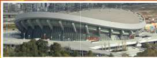
ΣΤΑΔΙΟ ΕΙΡΗΝΗΣ & ΦΙΛΙΑΣ